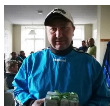
hul 10 – 6,49 m