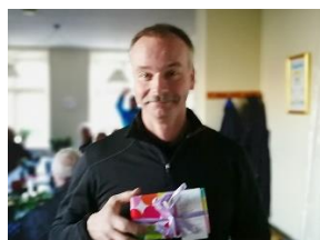
Hul 8 – 6,02 m