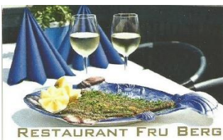
RESTAURANT FRU BERG

Nordsøtrawl AS Nordsøkaj 18 7680 Thyborøn Denmark Phone +45 9783 2090 Fax +45 9783 1280 www.nordsotrawl.dk thy@nordsotrawl.dk VAT 34903018